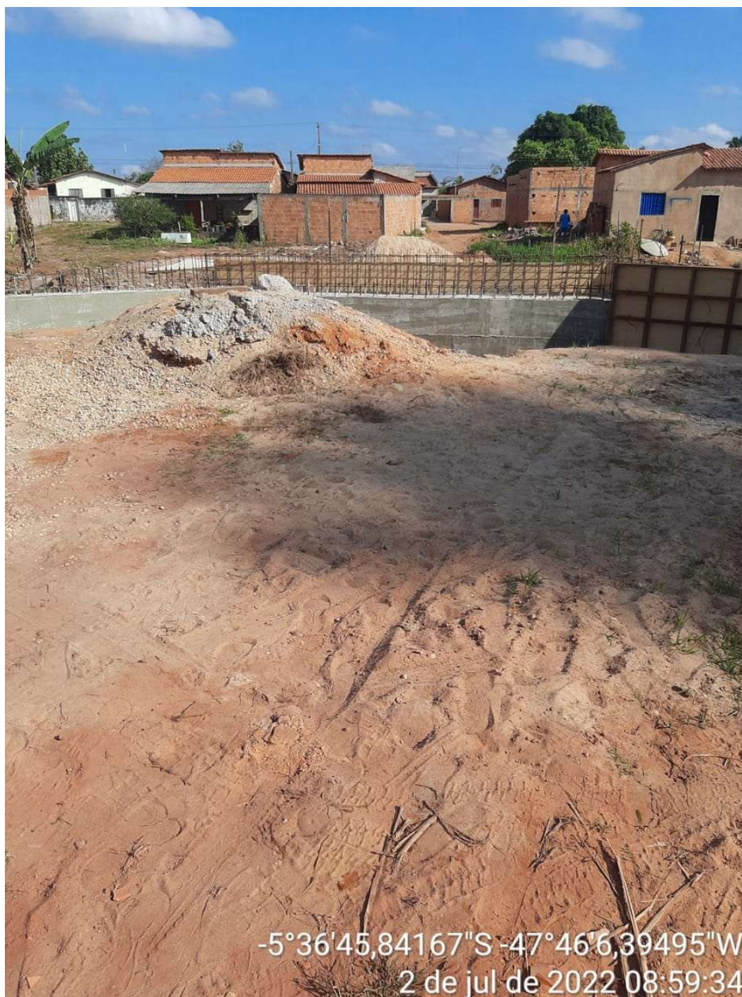
2. RUA DO COMÉRCIO (725,41 METROS)